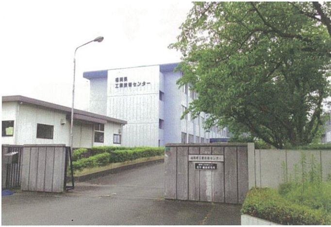
隣接する「福岡県工業技術センター」 立地：福岡県工業技術センター隣接 筑紫野ICから福岡市街地・九州各地へのアクセス至便